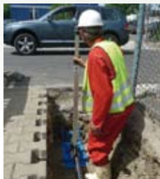
Passages sous la route, les jardins et des voies ferrées.