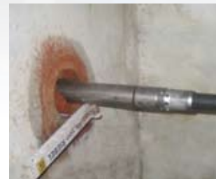
Forages directs depuis les bâtiments.