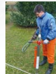
Création de fondations.