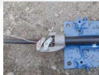
Accessoires pour la traction directe pour les tubes PE et PVC.