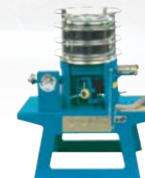
Réchauffeur d'air comprimé UNITHERM pour l'utilisation hivernale.