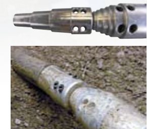
Extraction d'anciennes conduites d'acier.