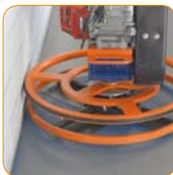
Distance du mur : 10mm