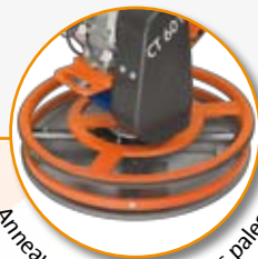
Anneaux de protection des pales.