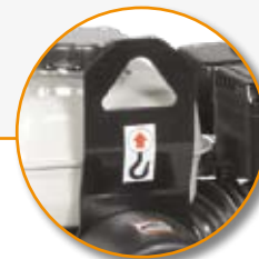
Anneau de levage.