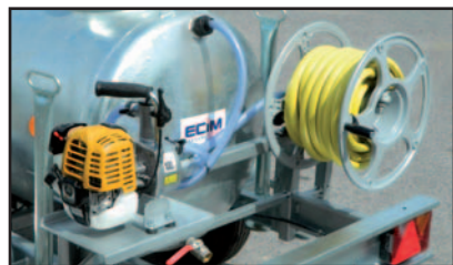
Option kit arrosage