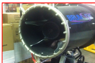
Double cerce de buses