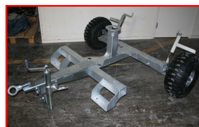
Système mobile 3 roues