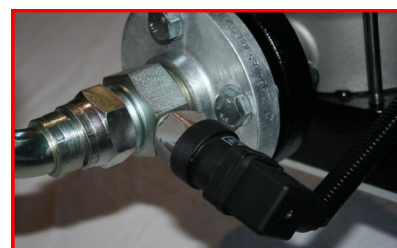
Pressostat manque d'eau