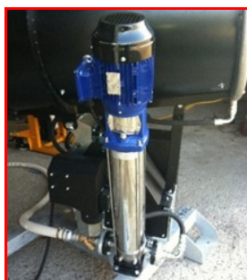
Pompe de transfert