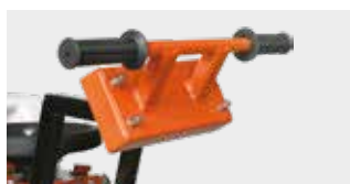
CHÂSSIS ET GUIDON ÉQUIPÉS DE SUSPENSIONS ÉLASTIQUES POUR MOINS DE VIBRATIONS