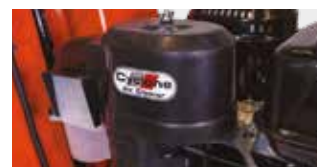
FILTRE À AIR CYCLONIQUE