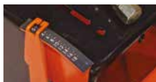
INDICATEUR DE PROFONDEUR DE COUPE