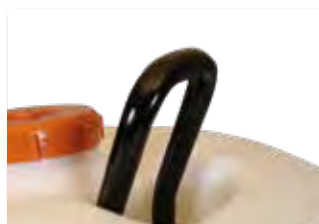
Anneau de levage au centre de gravité