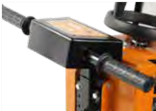
Poignées anti-vibrations réglables en hauteur