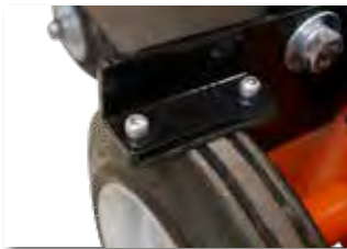
Frein de parc