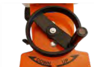
Plongée par volant