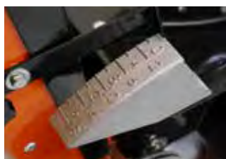
Indicateur de profondeur de coupe