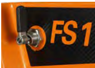
Loquet de blocage plongée